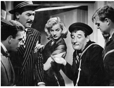
1957 RASCEL-FIFI de Guido Leoni avec Gino Buzzanca, Gisella Sofio, Renato Rascel