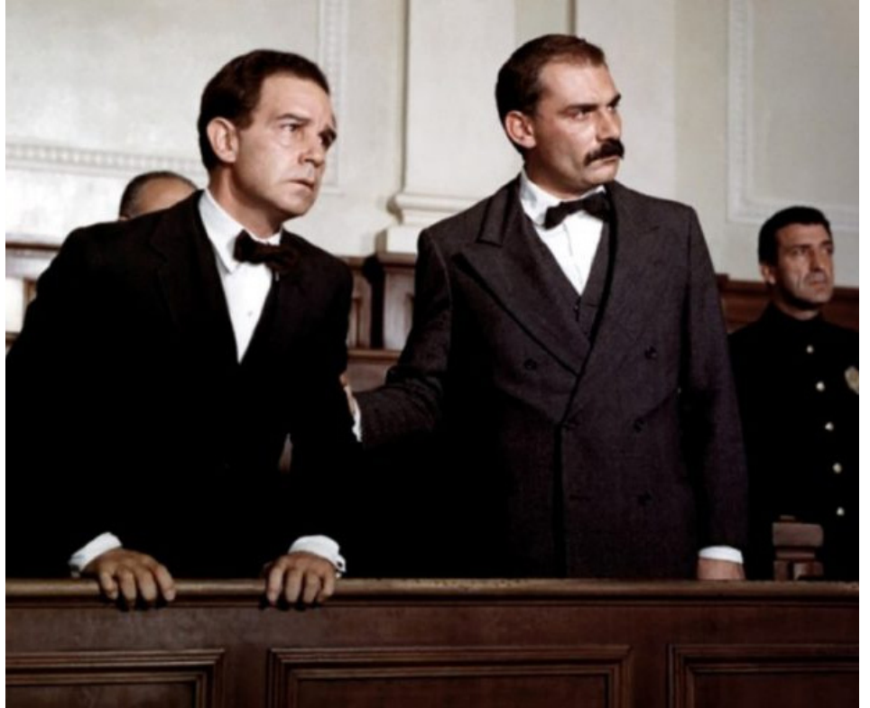
1971 SACCO ET VANZETTI (Sacco e Vanzetti) de Giuliano Montaldo avec Gian Maria Volonté