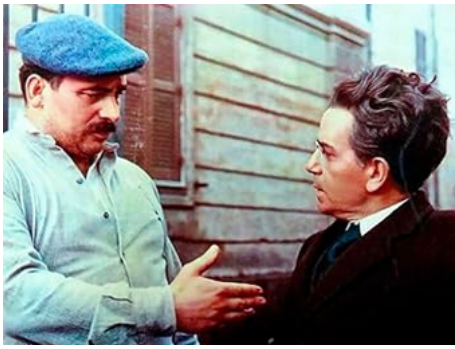
1973 L'AFFAIRE MATTEOTTI (Il Delitto Matteotti) de Florestano Vancini avec Andrea Aureli