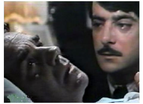
1973 CE COCHON DE PAOLO (Paolo il caldo) de Marco Vicario avec Giancarlo Giannini