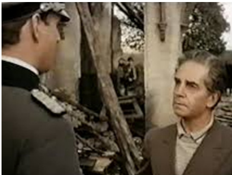
1976 LA LIGNE DU FLEUVE (La linea del fiume) d'Aldo Scavarda