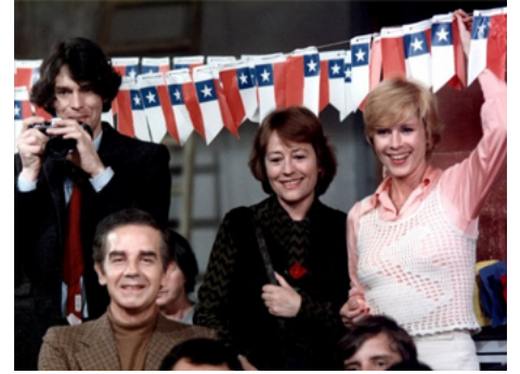
1975 IL PLEUT SUR SANTIAGO d'Helvio Soto avec Laurent Terzieff, Annie Girardot, Bibi Andersson