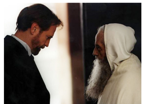
1997 OUR GOD'S BROTHER (Brat naszego Boga) de Krzysztof Zanussi avec Christopher Waltz