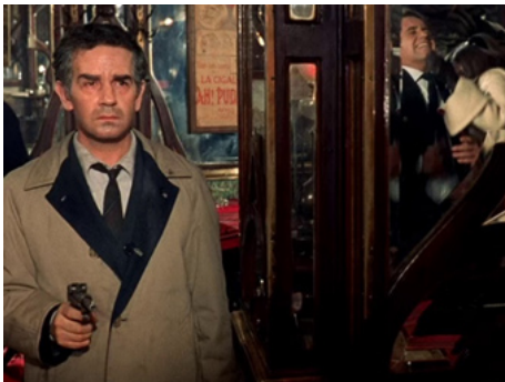
1969 PERVERSION STORY (Una sull'altra) de Lucio Fulci