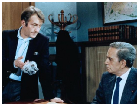
1987 TOUT EST DANS LA FIN de Jean Delannoy avec Michel Duchaussoy