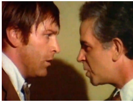
1973 CONSIDÉRONS L'AFFAIRE COMME TERMINÉE de Vittorio Salerno avec Enzo Cerasico