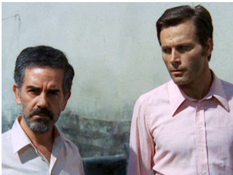
1971 NOUS SOMMES TOUS EN LIBERTÉ PROVISOIRE de Damiano Damiani avec Franco Nero