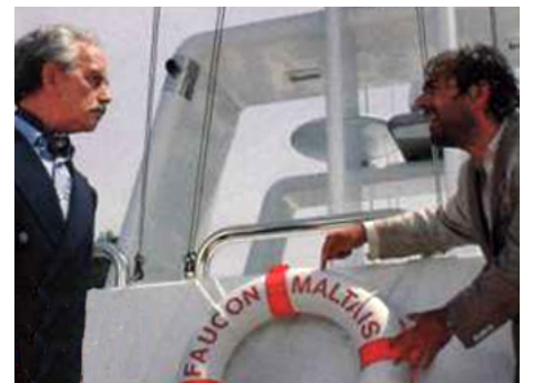
1989 VANILLE FRAISE de Gérard Oury avec Pierre Arditi