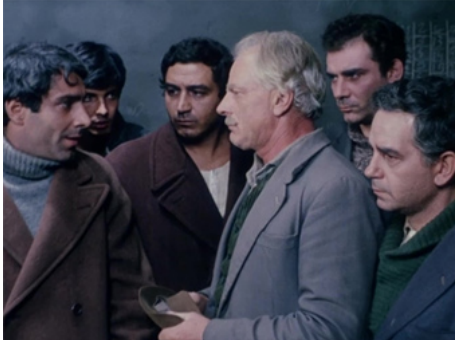
1967 I SETTE FRATELLI CERVI de Gianni Puccini avec Oleg Zhakov, Don Backy, Gian Maria Volonté,