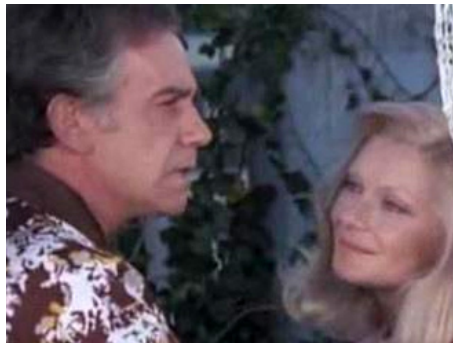
1971 SEULS LES OISEAUX VOLENT EN LIBERTÉ de Marilio Scarpelli avec Macha Meril