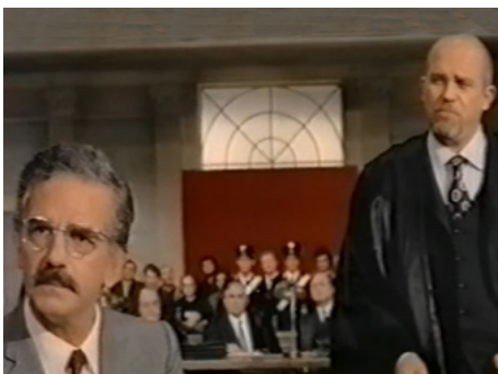
1972 LES MAFFIOSI (La violenza : quinto potere) de Florestano Vancini avec Gastone Moschin