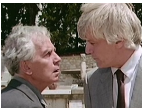
1993 LE CHÂTEAU DES OLIVIERS de Nicolas Gessner avec Jacques Perrin