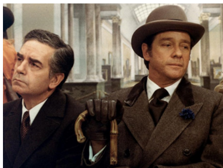
1972 UN FLIC de Jean-Pierre Melville avec Richard Crenna