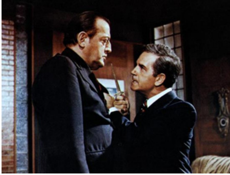
1974 BORSALINO AND CO de Jacques Deray avec Reinhard Koldehoff